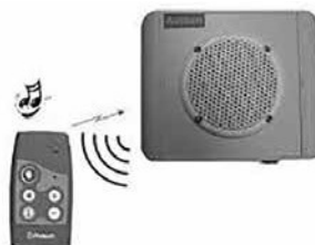
Balise et télécommande Phitech